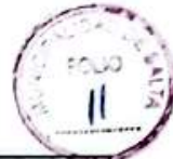
Tabla N° 1 - Continuación

(5) El ensayo de durabilidad por ataque con sulfato de sodio se hará sólo en el caso de que el ensayo de absorción arroje un resultado superior al especificado