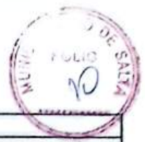
Tabla N° 1 - Requisitos de los agregados gruesos vírgenes