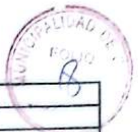
Tabla N° 3 - Requisitos de los agregados finos vírgenes