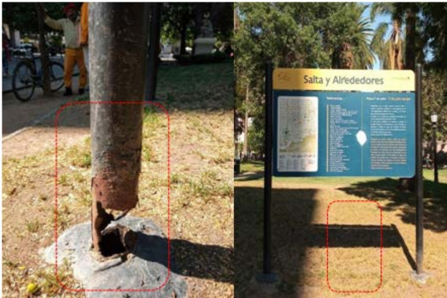
Modelo de referencia